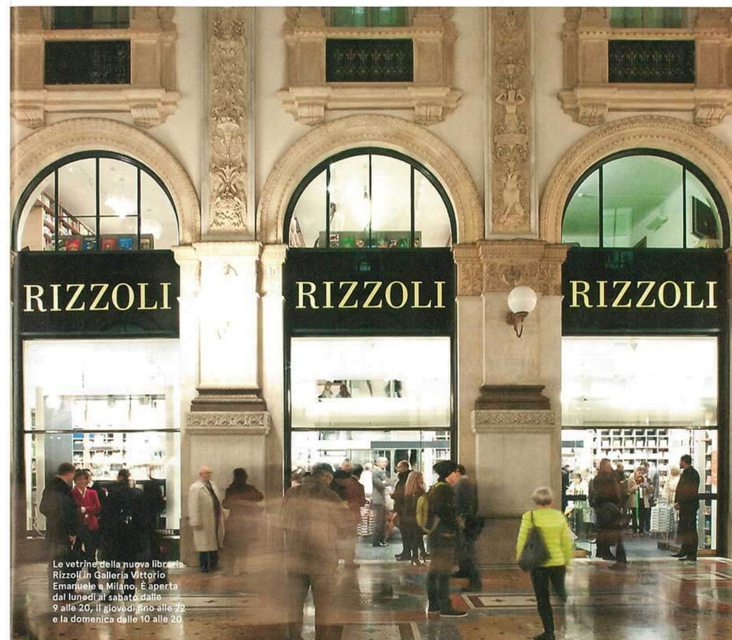
Le vetrine della nuova libreria Rizzoli in Galleria Vittorio Emanuele a Milano. È aperta dal lunedì al sabato dalle 9 alle 20, il giovedì fino alle 22 e la domenica dalle 10 alle 20