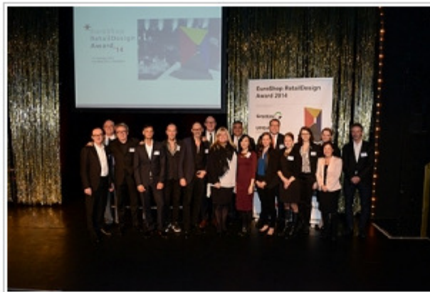
Foto de familia de los premiados